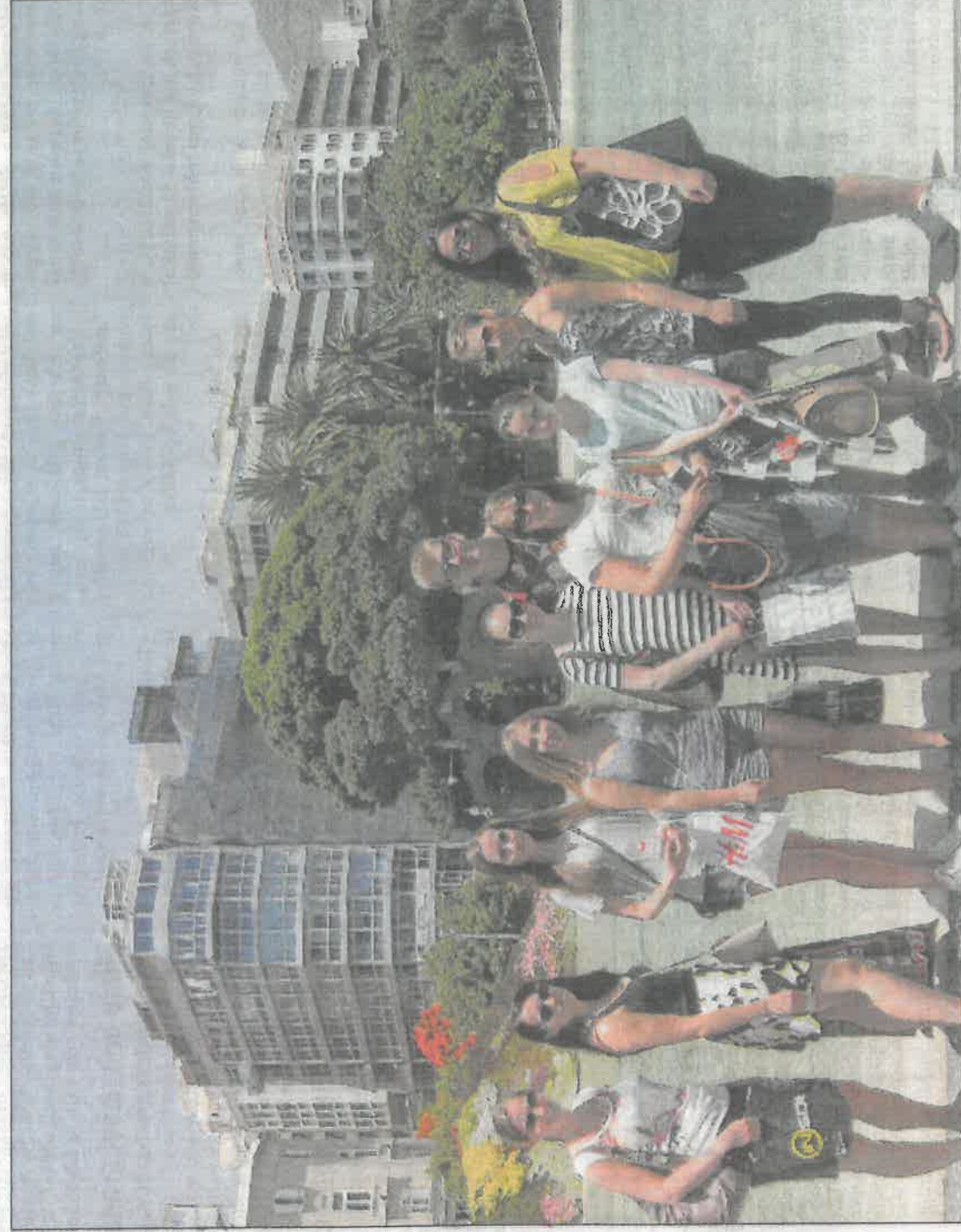
Díky programu Erasmus+ navštívili studenti z Přímky Tenerife.

Naším cílem je, aby žák zvládl cizí jazyk na úrovni B1. Volíme