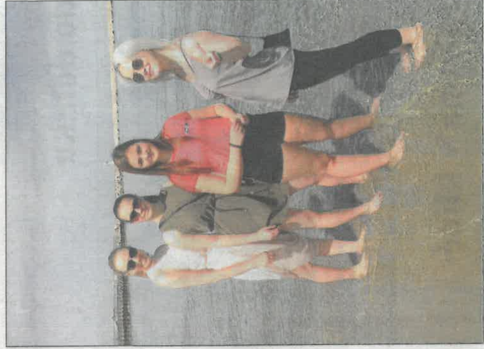
Děvčata si užívala nádherné chvíle volna u ještě nádhernějšího moře na Krétě.

formu komunikace a aktivní me- tody výuky. Studenti mají možnost účastnit se projektů Erasmus+ a jazykové poznávacích pobytů nebo výletů v Londýně, Vídni nebo Paříži. Výuka je podpořena účastí na soutěžích, Evropském dni ja- zyků či návštěvami divadelních představení v cizím jazyce.