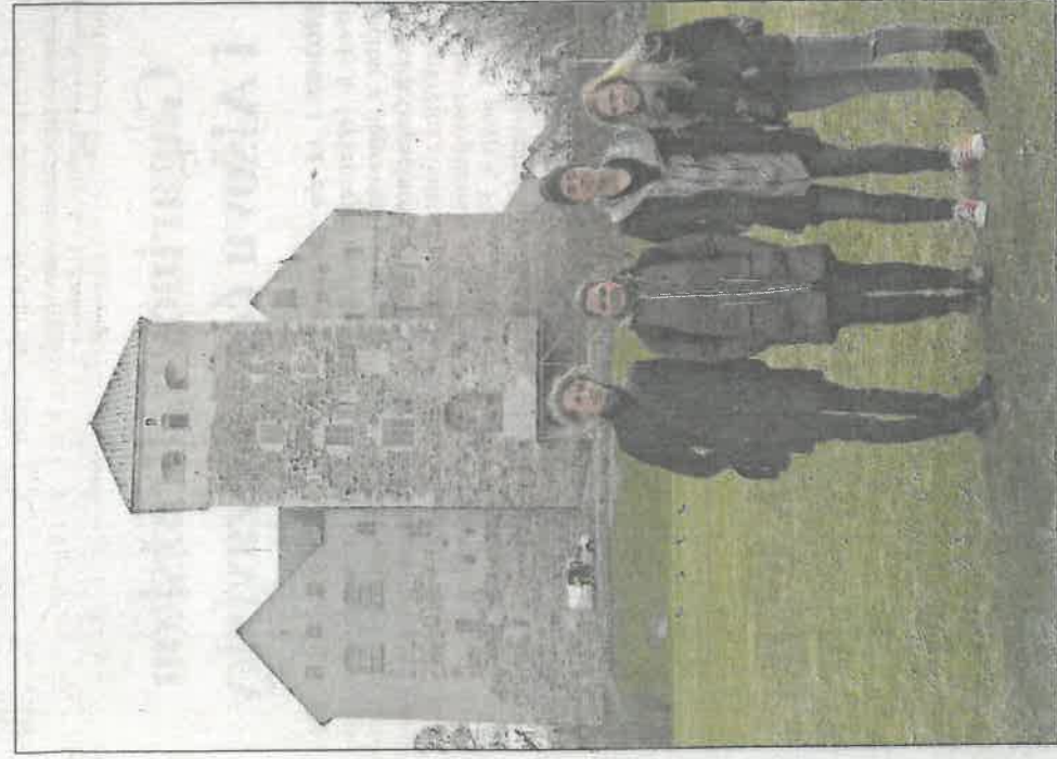
Na stáži ve Finsku obdivovali studenti krásu přírody i tamní ar- chitekturu.