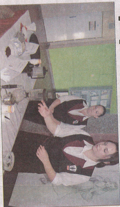
Studentky školy rády vysvětlily návštěvníkům, jak se také dá připravit výborná káva.

ZNOJMO (be). Doslova omamná může být pro mnohé vlně čerstvě pomleté kávy. Tato vůně byla cítit ve čtvrtek ihned po příchodu do školní budovy na Sítědním odbořeném učišti na Přímětické. Studenti zde pro veřejnost připravili Mezinárodní den kávy. Kromě komentovaných prohlídek a přednášek tu na návštěvníky čekala také degustace mnoha druhů kávy, mohli se podrobit kávové masáži či kávovému zábalu proti celulitidě, mohli zkusit kávový peeling či kávovou koupel nohou. Bez zajímavosti nebyla ani výroba špekát z kávy, tu si vyzkoušeli i menší návštěvníci akce.